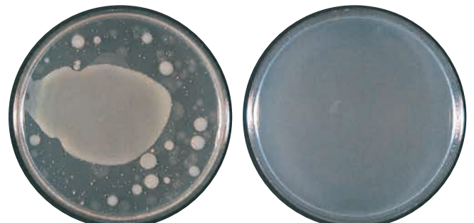
精製水に試験菌を培養